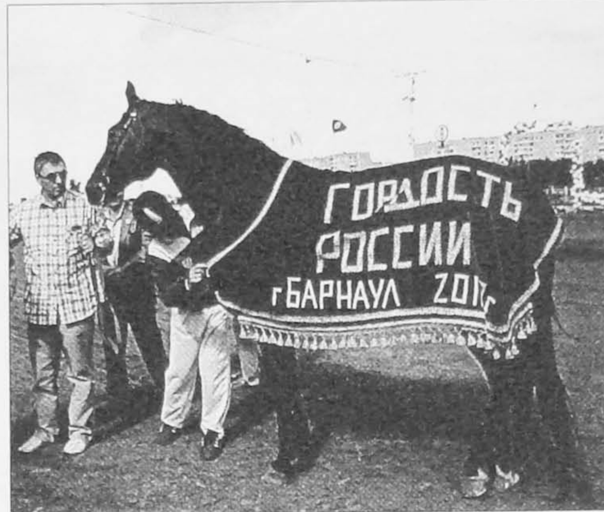
Такую попону носят единицы орловцев. Только чемпионы породы.